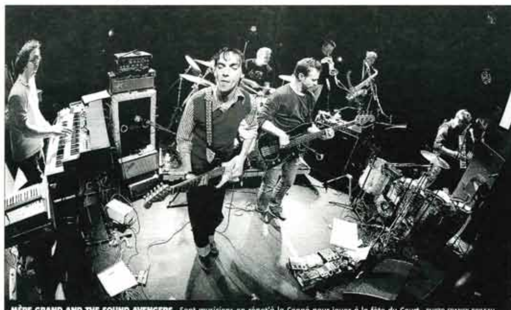
MÈRE GRAND AND THE SOUND AVENGERS. Sept musiciens en répétition à la Coopé pour jouer à la fête du Court.

Imaginez Chapeaux melons et bottes de cuir ou Drôles de dames interprétés à la sauce Glomeau par sept musiciens dont le quidam précité. Une vraie avant première pour un projet sorti des neurones de Marc Glomeau, pé-